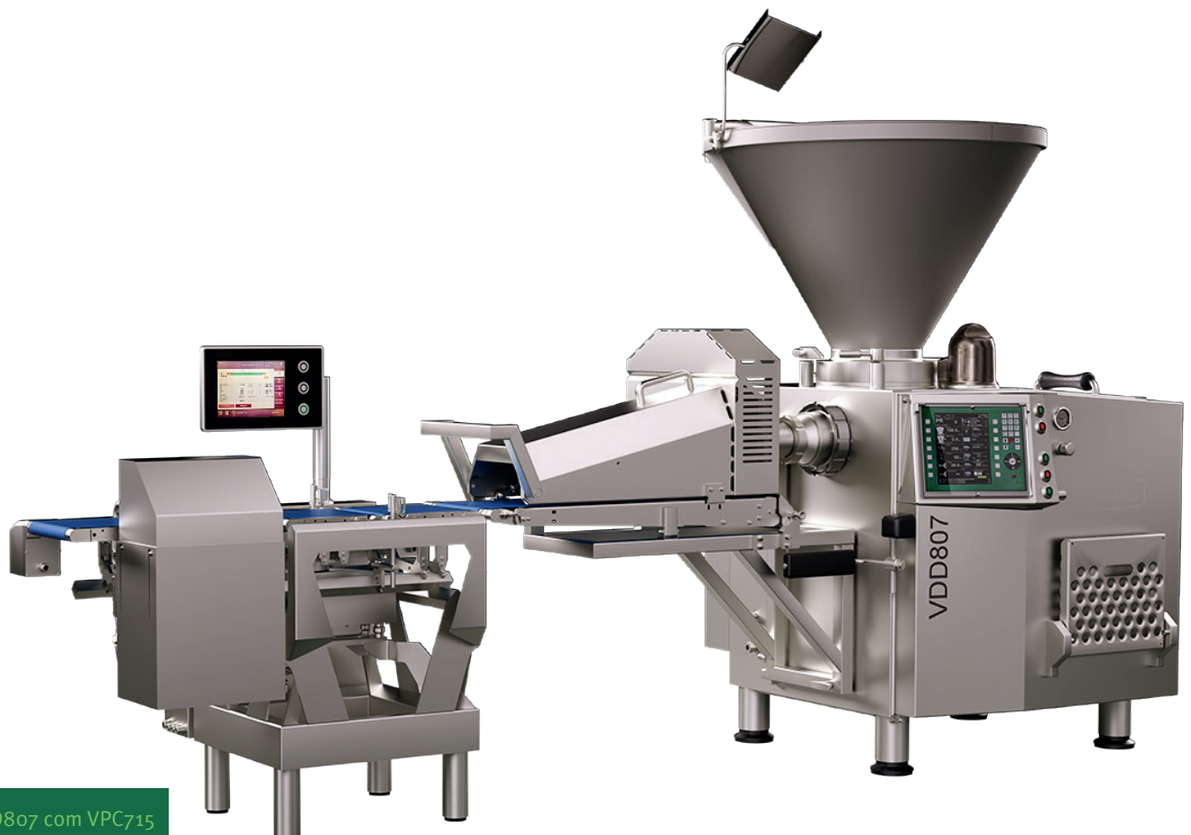
VDD807 com VPC715